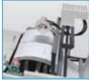
Sıcak Dilimleme Ünitesi