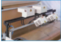
Sıcak Dilimleme Ünitesi